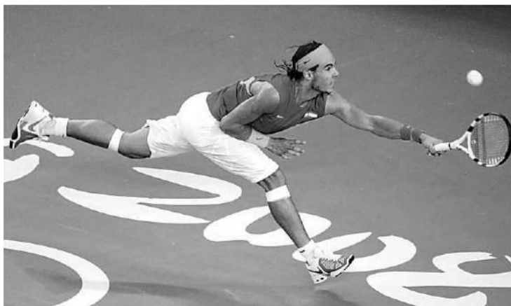
Nadal pelea un punto en el partido por el oro contra Fernando González.

El oro de Rafa Nadal congregó el domingo a más de la mitad de los espectadores (53,6% de share ) y otorgó a la cadena pública su mejor domingo del año. El partido se convirtió en la prueba olímpica más vista hasta el momento. Incluso, la entrega de medallas en tenis despertó la curiosidad de los espec-