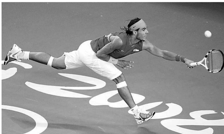
Nadal pelea un punto en el partido por el oro contra Fernando González.

El oro de Rafa Nadal congregó el domingo a más de la mitad de los espectadores (53,6% de share ) y otorgó a la cadena pública su mejor domingo del año. El partido se convirtió en la prueba olímpica más vista hasta el momento. Incluso, la entrega de medallas en tenis despertó la curiosidad de los espec-